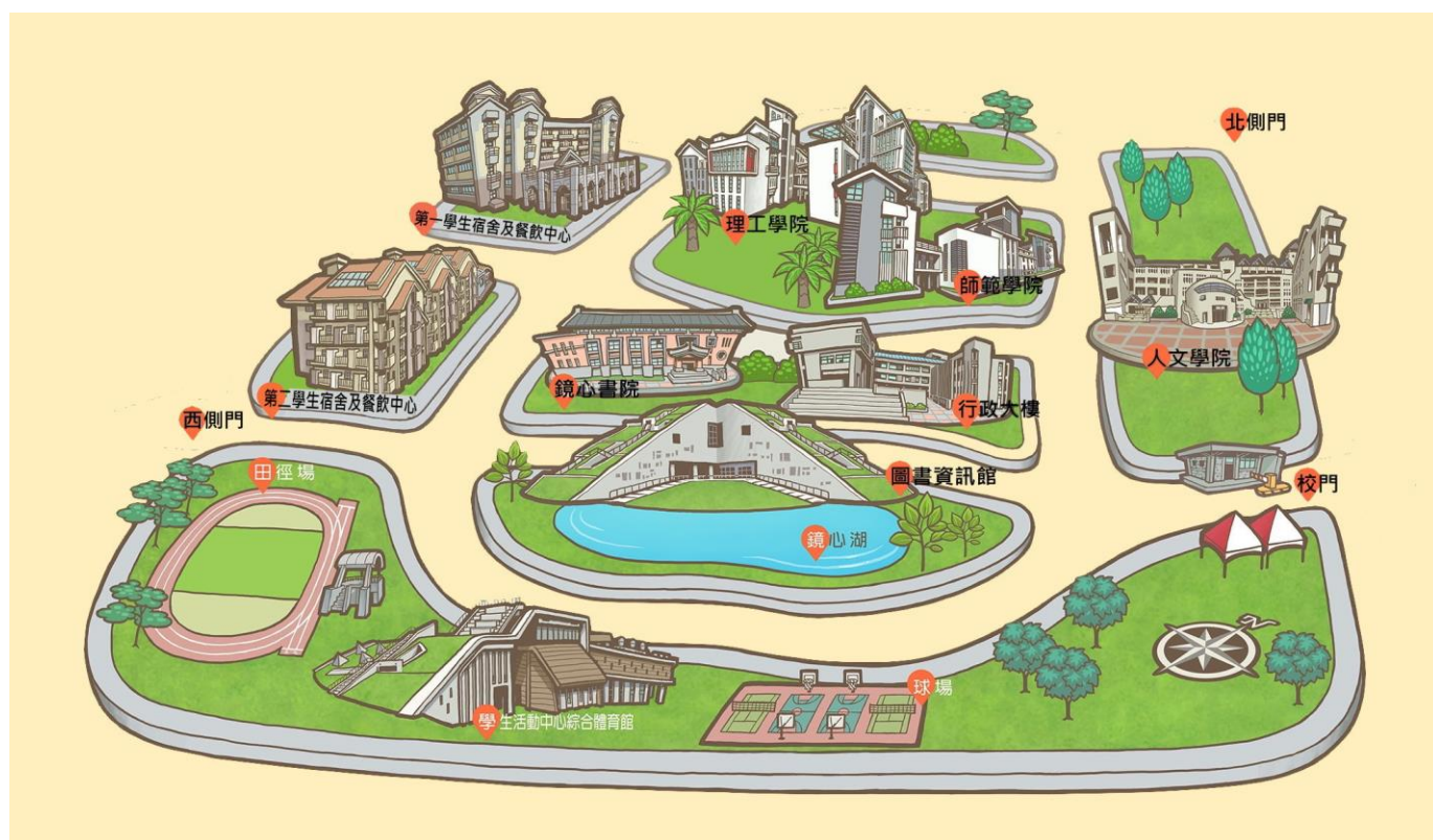
國立臺東大學校本部(知本校區)校園配置圖